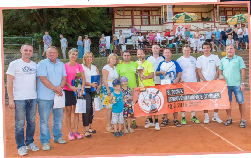
▲ Vítězové tenisového turnaje Lázně Luhačovice Cup 2016