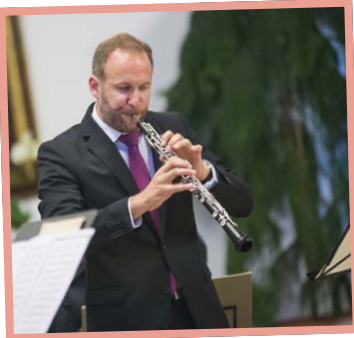
▲ Festival Janáček a Luhačovice - V. Veverka

▼ Dny slovenské kultury - Folklorní soubor Karpaty