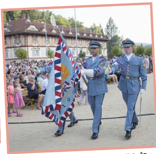
▲ Koncert Hudby Hradní stráže a Policie ČR