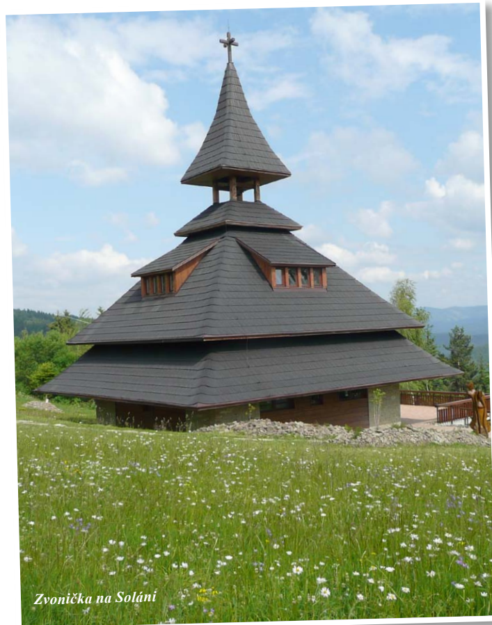
Zvonička na Soláni

Muzeum ve Velkých Karlovicích s etnografickou expozicí bydlení na Valašsku a kostel Panny Marie Sněžné. Zvonička na Soláni. Posezení v Kolibě U splavu v Hovězím.