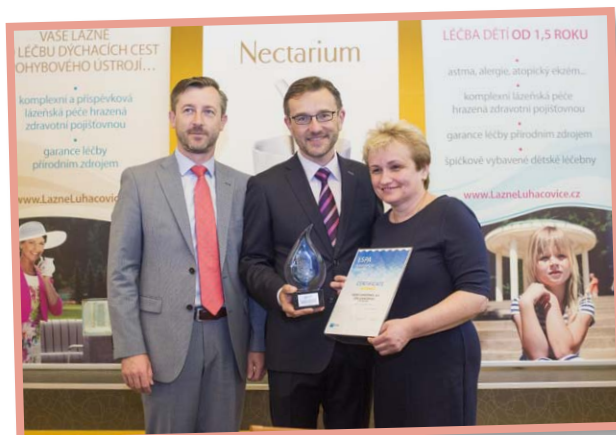
▲ Ocenění Evropského svazu lázní ESPA Innovation Awards 2016