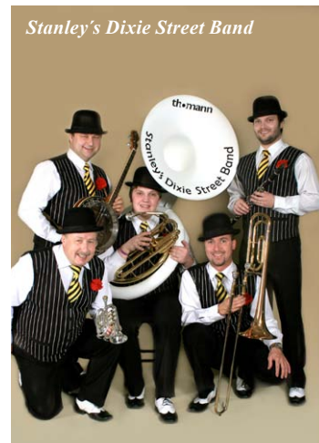
Stanley's Dixie Street Band

Večer v pohodové atmosféře 20. let s klasickým dixielandem. Alexandria**** Spa & Wellness hotel - night club