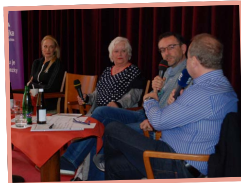
▲ Tobogan ČRo 2