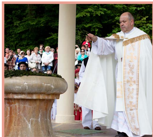
▲ Otevírání pramenů