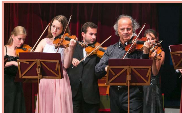
▲ Zahajovací koncert Akademie Václava Hudečka