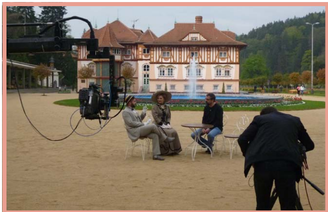
▲ Dobré ráno s Českou televizí