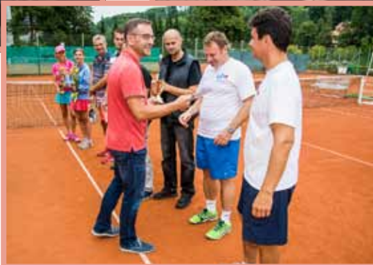
▲ Předávání cen výhercům tenisového turnaje Lázně Luhačovice Cup 2015.