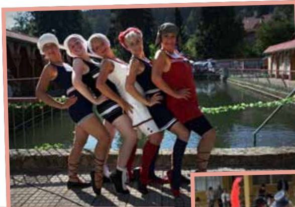
◀ Rozloučení s létem ve Slunečních lázních / Okrašlovací spolek Calma.