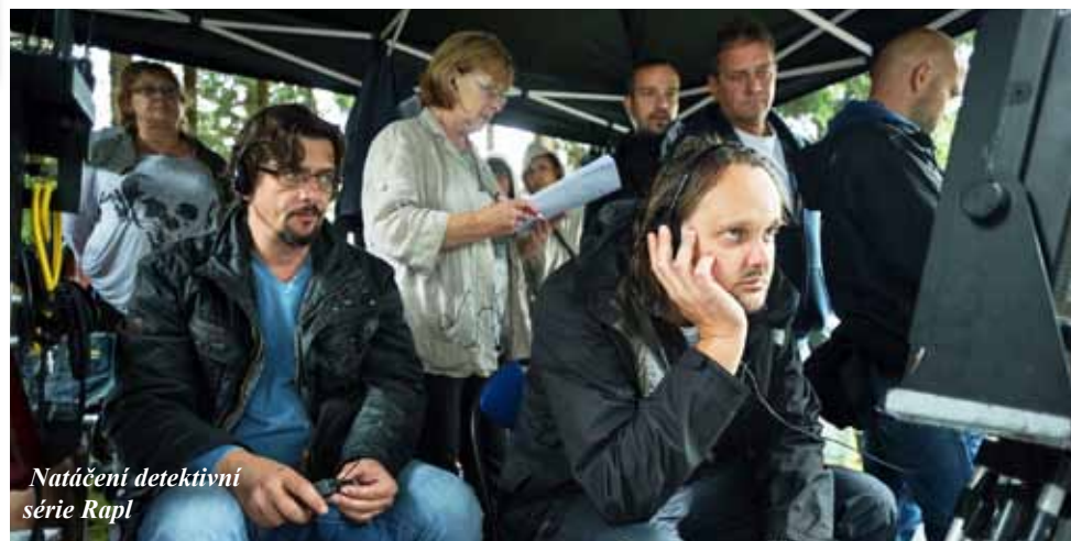
Natáčení detektivní série Rapl