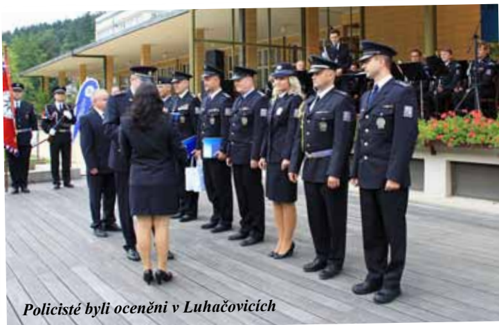
Policisté byli oceněni v Luhačovicích

Lázeňské náměstí v Luhačovicích patřilo na jedno zářijové odpoledne policii. Uskutečnilo se zde totiž Slavnostní odpoledne Krajského ředitelství policie Zlínského kraje.