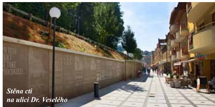
Stěna cti na ulici Dr. Veselého

Luhačovice mají dlouho očekávané lázeňské korzo. Rekonstrukce ulice Dr. Veselého, která pojí centrum města s lázeňským areálem, byla v polovině září dokončena. Novou tvář získal celý úsek od pošty až po vilu Lékárna. Zajímavostí je přibližně šestnáctimetrová Stěna cti, která nese dvacet jmen významných osob, které jsou s Luhačovicemi spojeny (například zakladatelů lázní Serényiů, Leoše Janačka, Dušana Jurkoviče nebo Vlasty Buriana). Na ni navazuje malá městská kolonáda, klidová zóna s lavičkami. Výraznou proměnou prošla plocha před poštou, kde vzniklo malé náměstí i s pódiem. Úplně jiný tvar a vzhled získala také křižovatka před vilou Lékárna. Vytvořil se tak nový vstup do lázeňského areálu.