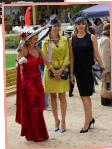
▲ Výherkyně soutěže o nejelegantnější návštěvníky Kloboukového dne.