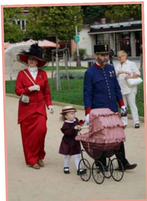
▲ Kloboukový den.