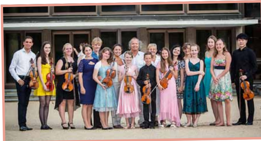
▲ Účastníci Akademie Václava Hudečka.