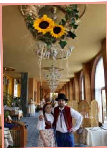
▲ Dožínkový brunch v hotelu Alexandria.