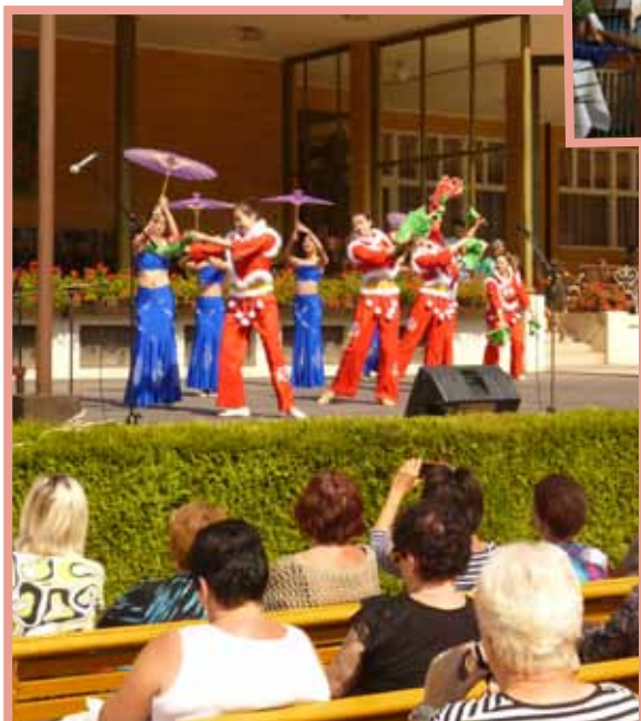
▲ Beijing Campus Dancing School – Peking, Čína.