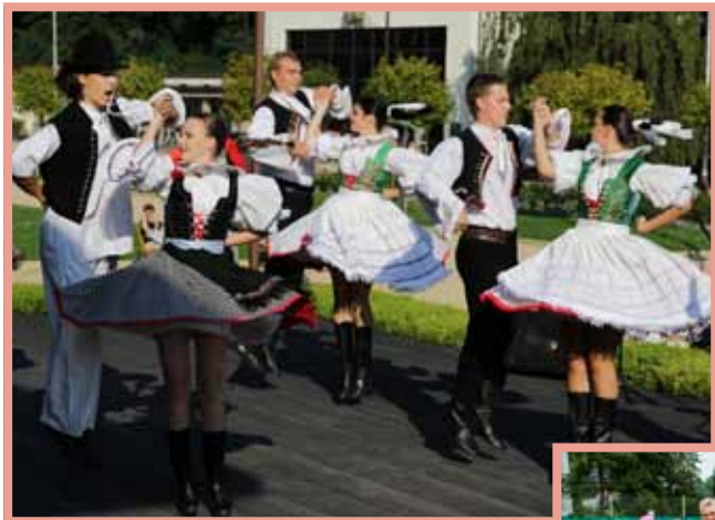
▲ Folklorní soubor Skaličan ze Slovenska.