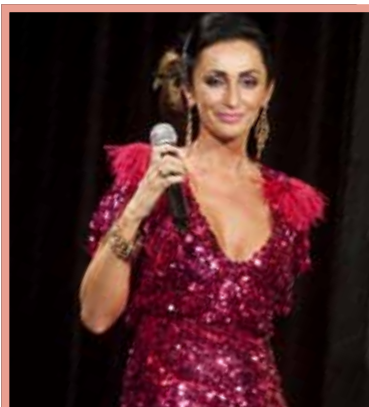
▲ Koncert Sisy Sklovské