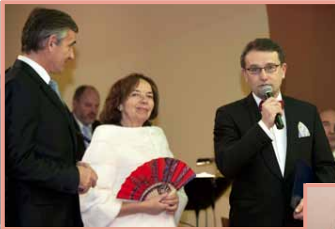
▲ 17. reprezentační lázeňský ples - zahájení