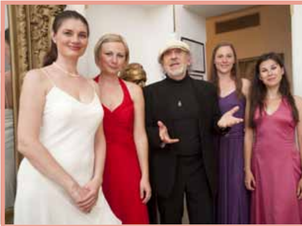
▲ Jiří Stivín & Beladona Quartet