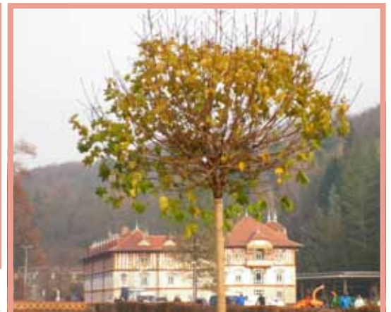
Obnova areálu lázní – nová výsadba stromů kolem řeky ▶