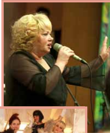
◀ Věra Špinarová ▼ Jiří Korn