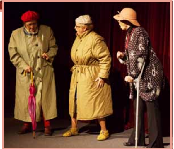
▲ Všetko o ženách – Luhačovická divadelní sešlost