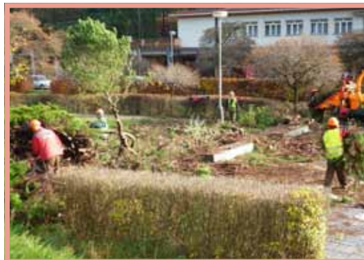
▲ Obnova areálu lázní – práce u Bruselské fontány