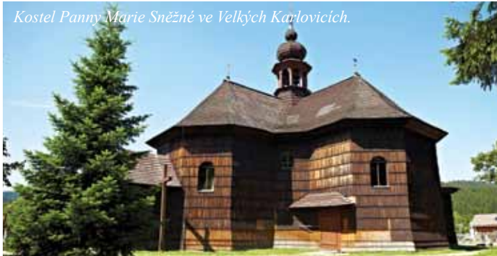
Kostel Panny Marie Sněžné ve Velkých Karlovicích.

PŘESNÁ MÍSTA A ČASY ODJEZDŮ NAJDETE V NABÍDKOVÝCH LETÁČÍCH. ZMĚNA ZÁJEZDŮ VYHRAZENA