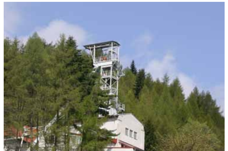
Důl Svornost v Jáchymově.