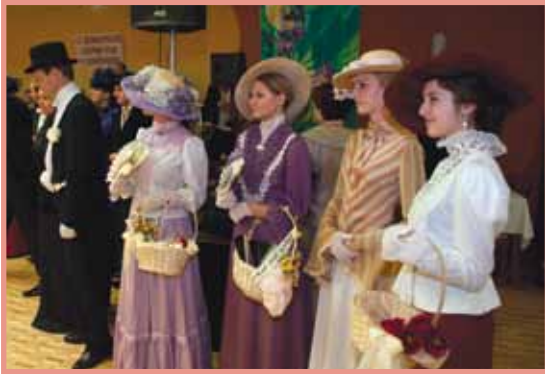
Luhačovický okrašlovací spolek Calma