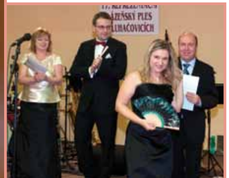
Předání cen „Vějířů štěstí“