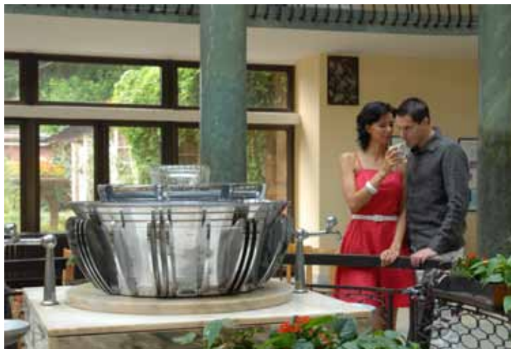
Pramen Vincentka v Luhačovicích.

V roce 2006 byl zvolen místostarostou města Jáchymov, od roku 2008 je starostou města.