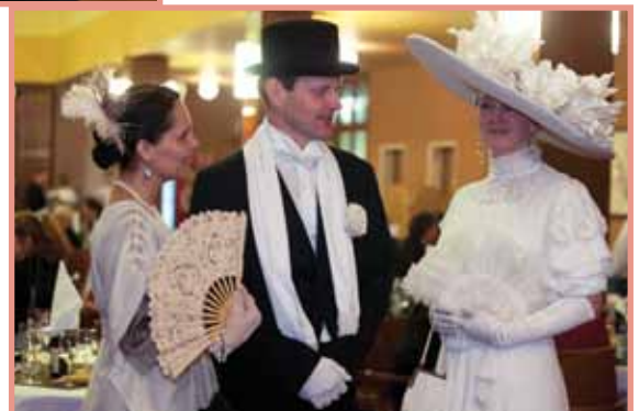
Luhačovický okrašlovací spolek Calma