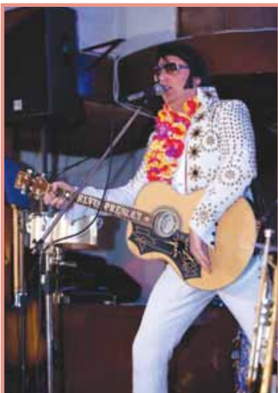
Elvis Presley Revival