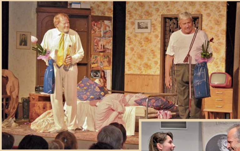
Divadelní Luhačovice – Kontrola nemocného, aneb Vrať mi to pyžamo