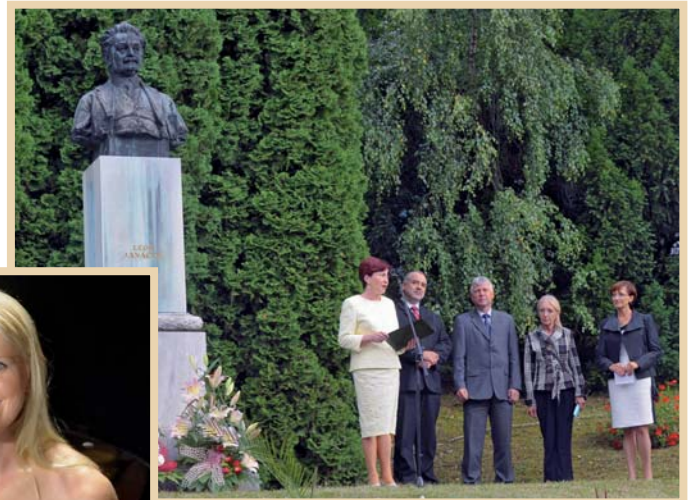
Festival Janáček a Luhačovice - slavnostní zahájení