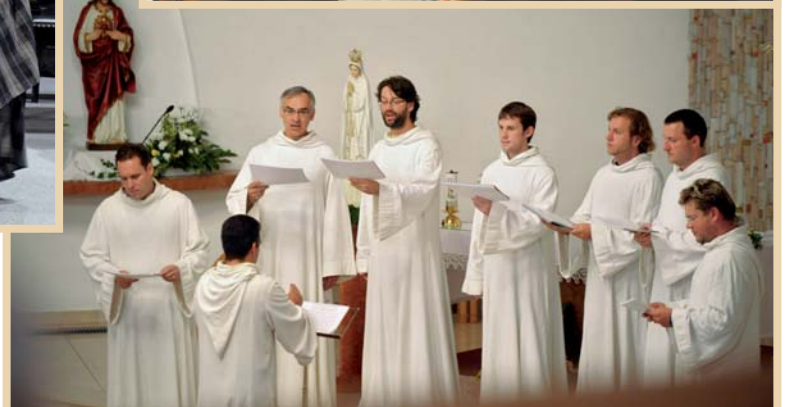
Festival Janáček a Luhačovice – koncert Scholy Gregoriana Pragensis