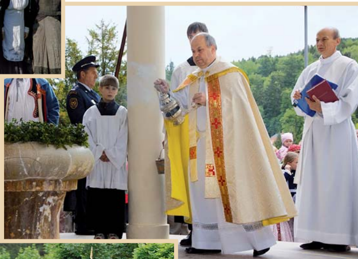
Svěcení pramene Ottovka