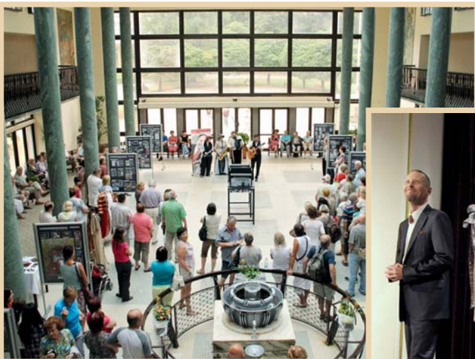
Vernisáž výstavy Městského divadla Zlín v hale Vincentka