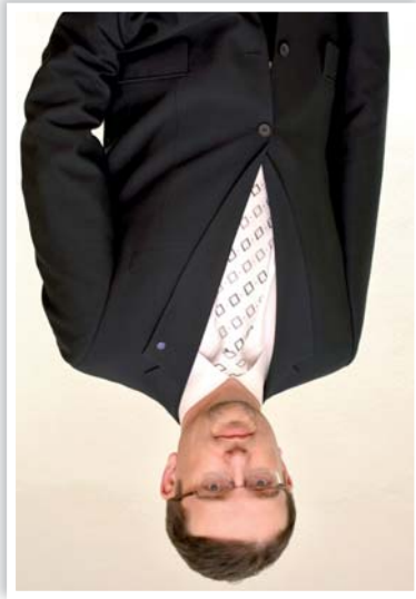
Sehr verehrte Gäste, liebe Kollegen