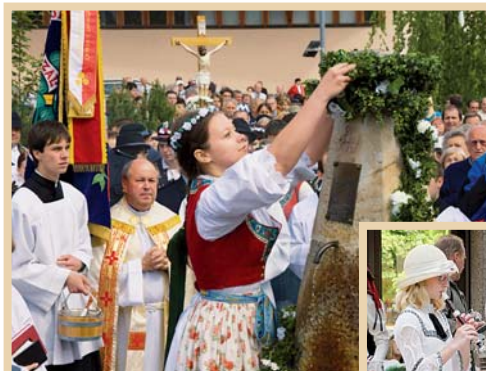
Svěcení pramene Sv. Josefa