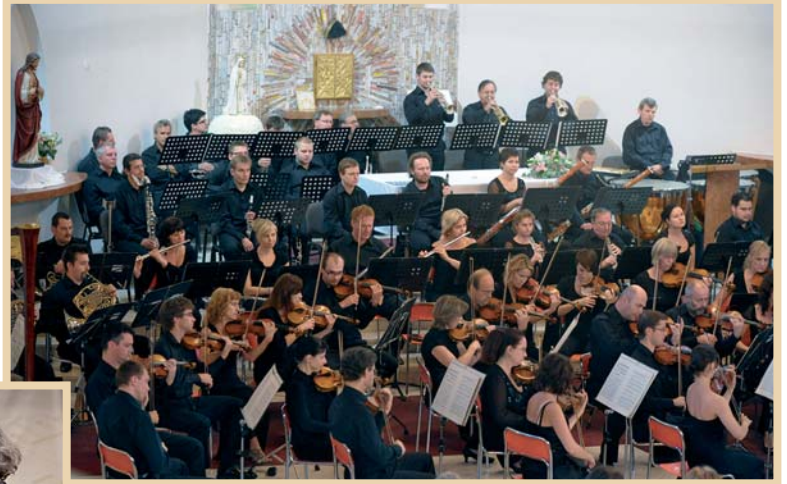
Festival Janáček a Luhačovice – zahajovací koncert