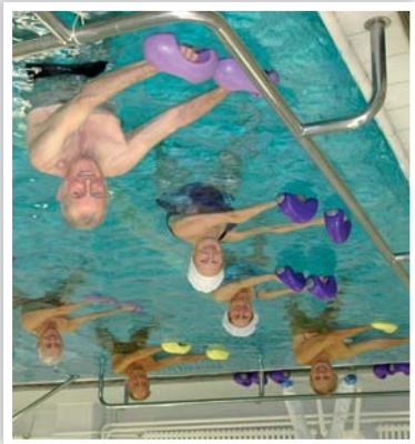
Dank der hohen Qualität der geleisteten Pflege, der Kompetenz des Gesundheitspersonals und der einzigartigsten Naturressource hat das Heilbad sein

Musiktherapie heilt Von der Richtigkeit der bekannten Behauptung, dass Musik heilsame Wirkungen habe, können sich unsere Kurpatienten und -gäste neulich auf dem Hotelzimmer, bei der Rast nach den Kuranwendungen überzeugen. Über den Fernsehbildschirm vernimmt man entspannende Musikstöße, die mit beruhigenden Bildern der Natur des Erzgebirges untermalt sind. Die Musiktherapie ist eine offiziell anerkannte Heilmethode. Es ist nachgewiesen, dass eine richtig gewählte Musik den Stoffwechsel beschleunigt, die Muskulatur aktiviert und dem psychischen Zustand des Menschen Wohltut, der mit dem körperlichen Zustand einhergeht. Der Anblick der Natur und der Aufenthalt darin gibt die Lebenslust zurück. Und die ist für die Beschleunigung der Heilung und Rekoneszenz enorm wichtig, wie britische Studien nachgewiesen haben, die die Geschwindigkeit der Genesung von denjenigen Patienten auf der Intensivstation verglichen haben, die einen Ausblick in die Natur hatten, und denjenigen, die nur in die Mauer oder auf die Gerätschaften starrten mussten. Gerade diese Effekte bündelt unser Musiktherapie-Fernsehkanal, den wir für die Potenzierung der heilsamen Wirkungen der traditionellen Kuranwendungen empfehlen.