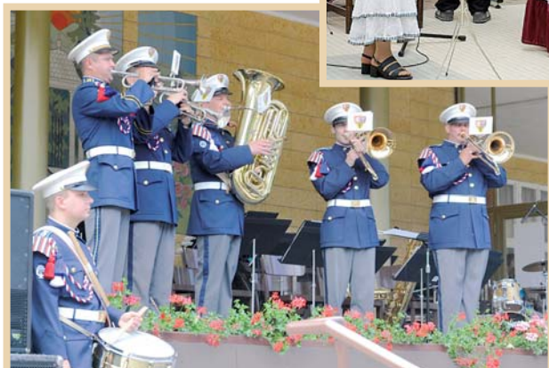
Hudba Hradní stráže a Policie ČR