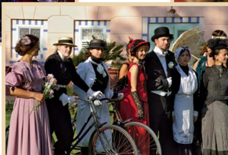
Luhačovický okrašlovací spolek Calma