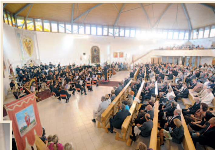
Festival Janáček a Luhačovice – zahajovací koncert