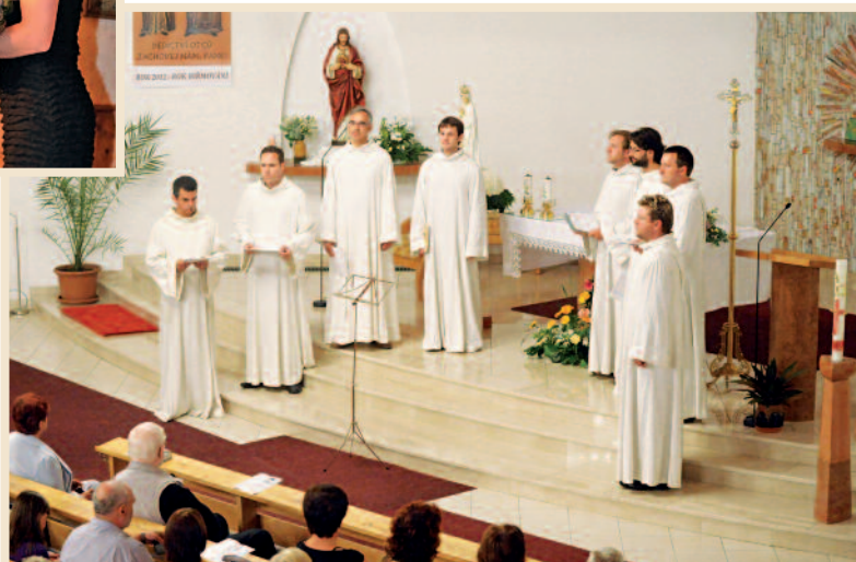
Festival Janáček a Luhačovice – koncert Scholy Gregoriana Pragensis