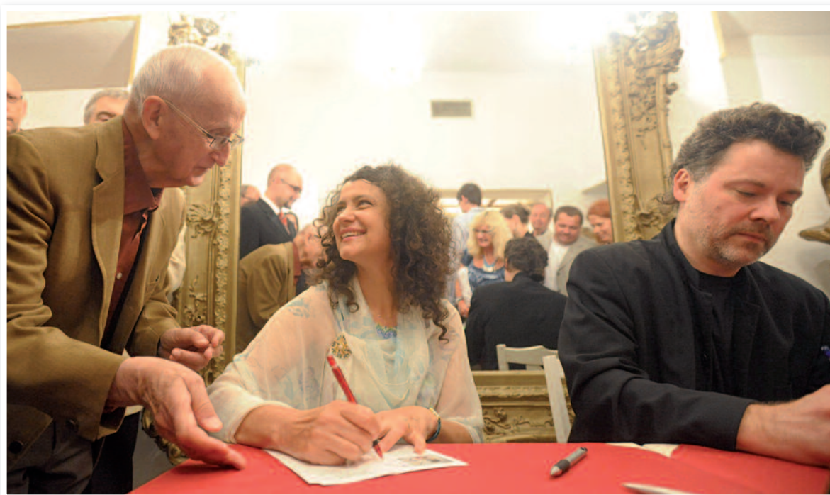
Autogramiáda Ivy Bittové a Pavla Fischera po festivalovém koncertu