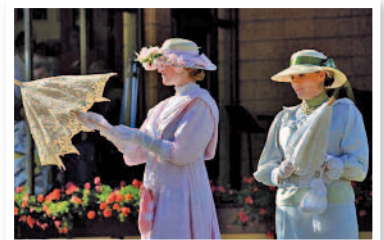
Kloboukový den - Kolonáda s Calmou