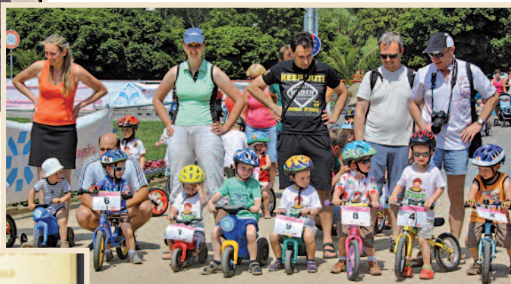
Tour de Kids