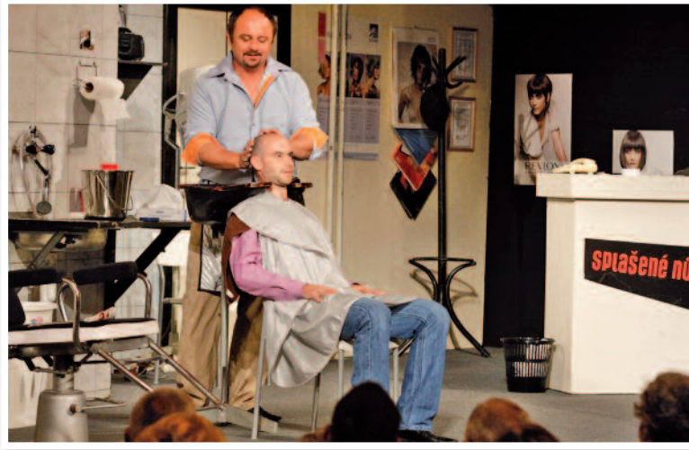
Divadelní Luhačovice - Splašené nůžky

Po ukončení Akademie Václava Hudečka vstoupila do Luhačovic divadel-