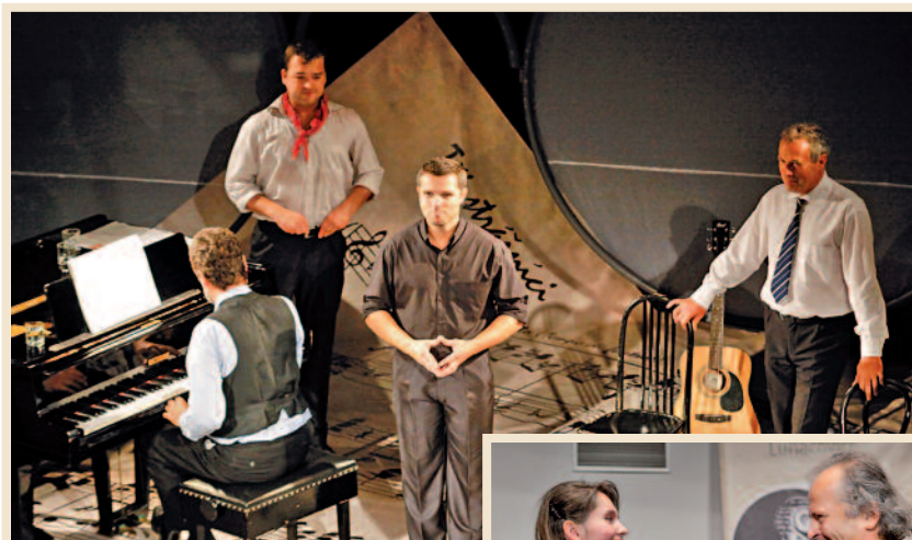
Divadelní Luhačovice – představení Tři strážníci