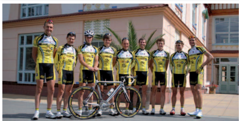
Tým ASC Dukla Praha před hotelem Jurkovičův dům