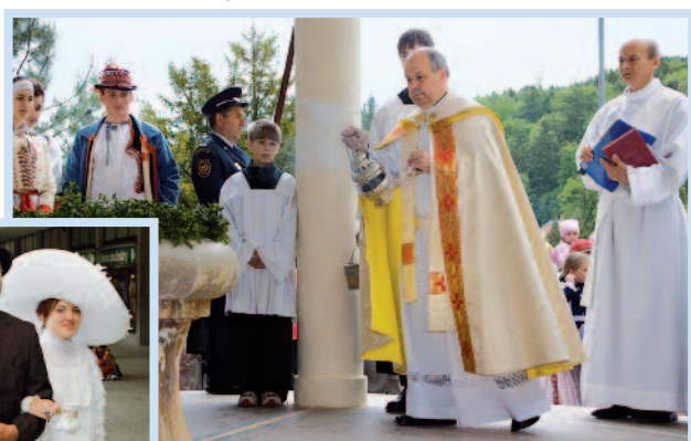
Svěcení pramene Ottovka