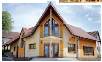
Betlém Horní Lideč