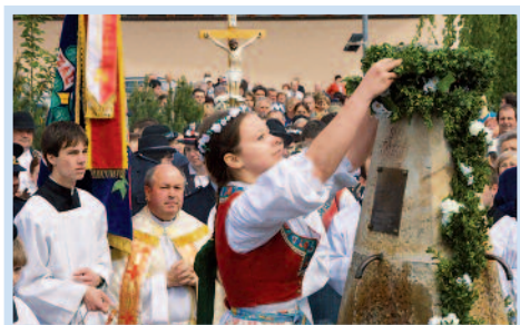
Svěcení pramene Sv. Josefa