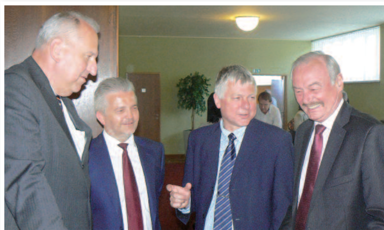
Europoslanec Evžen Tošenovský, náměstek hejtmána Zlínského kraje Libor Lukáš, starosta Luhačovic František Hubáček a 1. místopředseda Senátu Parlamentu ČR Přemysl Sobotka na shromáždění ODS