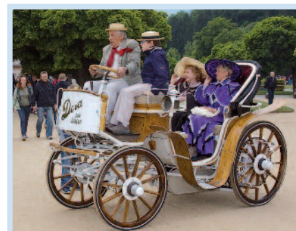
Přehlídka historických vozidel a dobových kostýmů