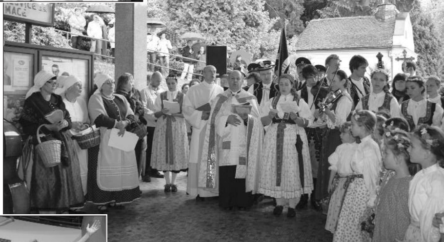
S kapličkou sv. Alžběty za zády – závěr svěcení