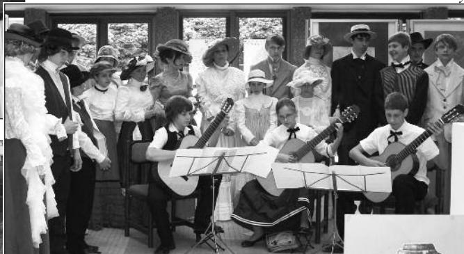
Vernisáž výstavy ve Vincentce