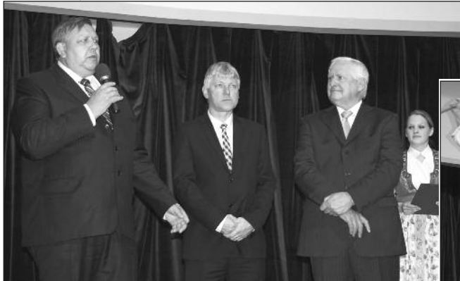
První muž kraje, města a Lázní – zahájení programu Návrat k tradicím