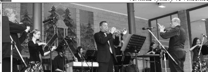
Zlínské jazzové smyčce ZUŠ Morava na kolonádě