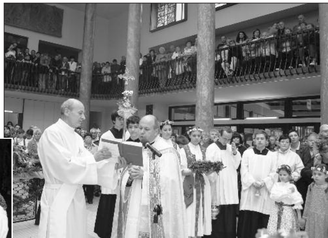
Obřad svěcení pramenů v hale Vincentky