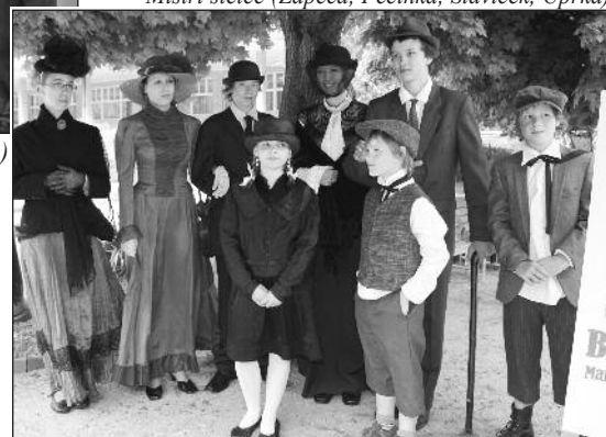
Rodina Bedřicha Smetany