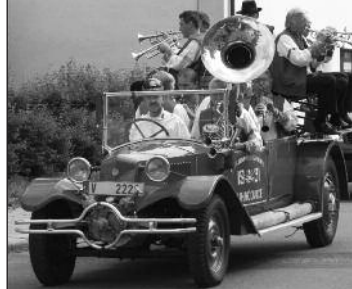
Pestrý jarmark Zálesanka s pozvánkou