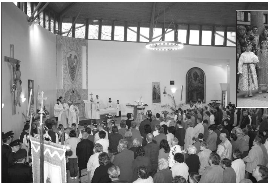
Slavnostní mše sv. v kostele Sv. Rodiny