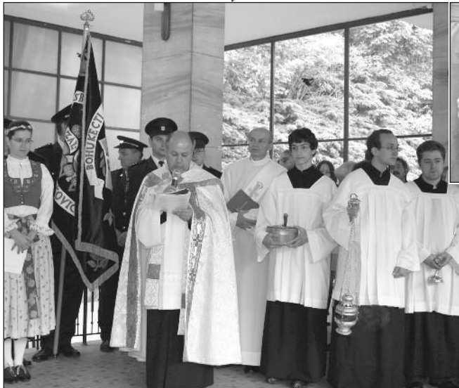
Kvůli dešti byla svěcena i Amandka na kolonádě