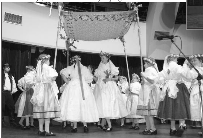
Text a foto – Marta Kozánková