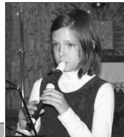
Koncert ZUŠ Luhačovice a Duo Musica Vista v kostele Sv. Rodiny