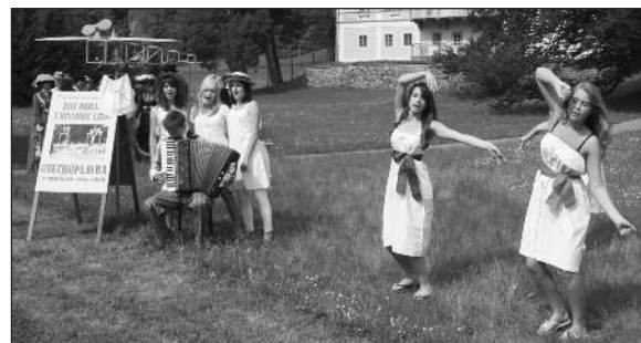
Vzduchoplavba v dívčím pojetí