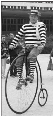
Bicykly s veterány