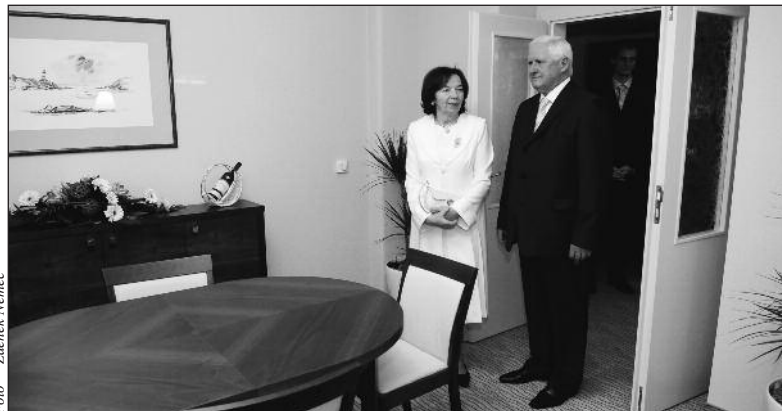
Zajímavé bylo nahlédnout do jednotlivých pokojů, obdiv sklidilo rovněž apartmá Alexandrie