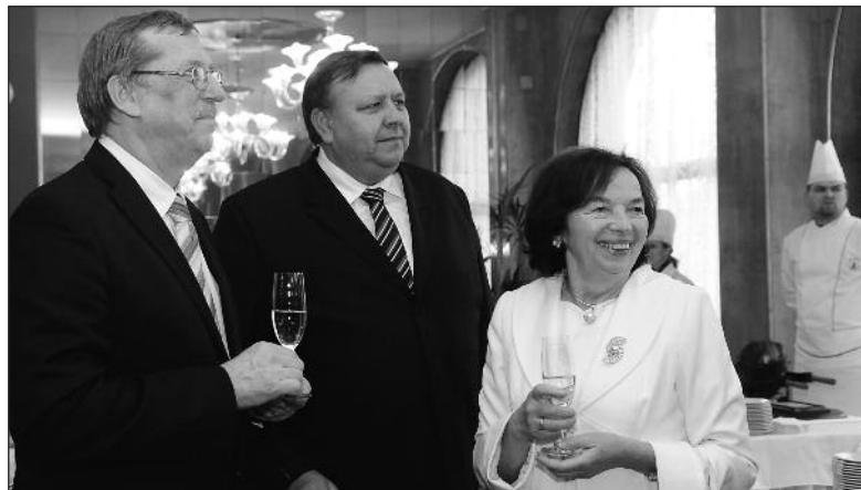
Ke slavnostnímu připitku byli hosté pozváni do francouzské restaurace – oba hejtmáni s první dámou republiky

samosprávy vytvořit prostor proto, aby Luhačovice a realizátoři jednotlivých projektů měli možnost na tyto peníze dosáhnout, protože Luhačovice získávají velkou kvalitu. Jak jsem říkal při zahájení, zdraví je hodnota, o kterou se má pečovat, myslím si, že každý, kdo navštíví Luhačovice, tak tu péči získá v maximální kvalitě.