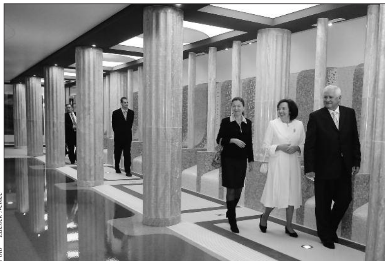
Impozantní bazén udělal při prohlídce dojem i na Livii Klausovou a její doprovod