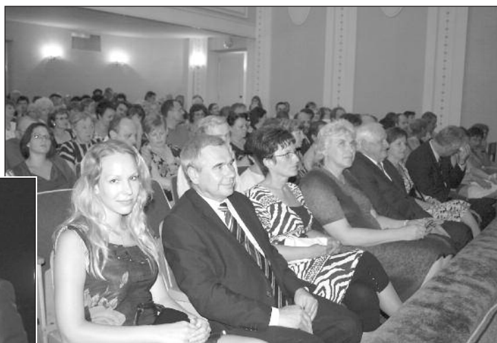
Publikum natěšeně očekává představení pražského Divadla Ungelt