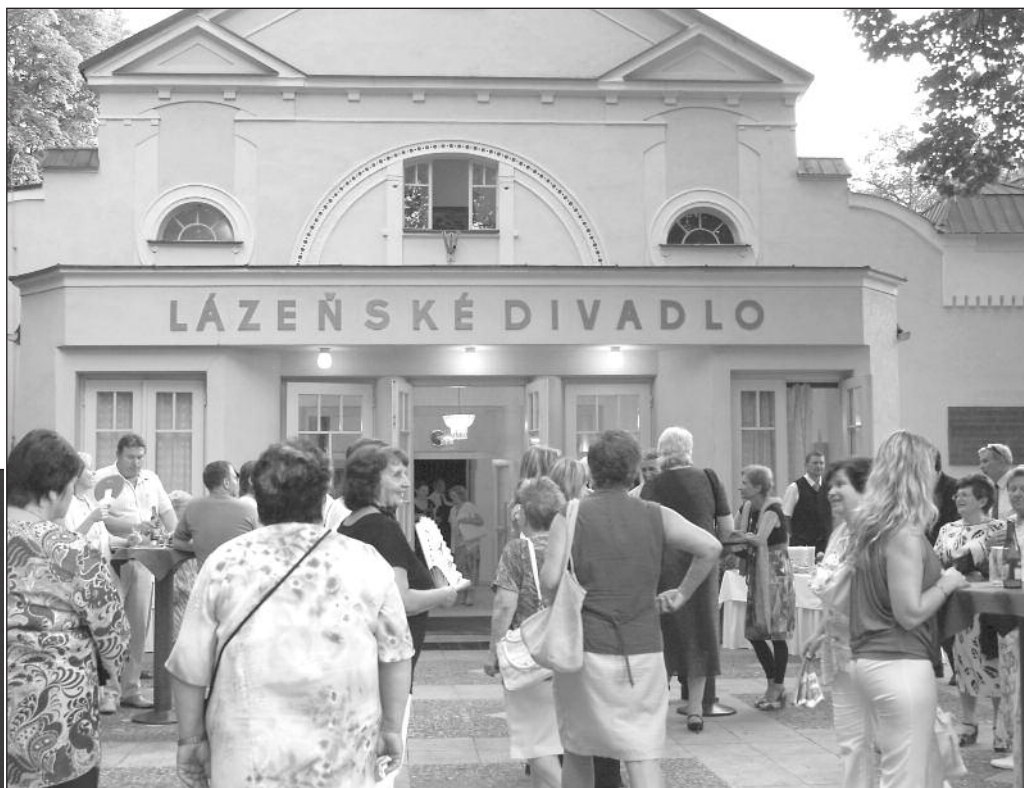
Hosté se scházejí k Lázeňskému divadlu