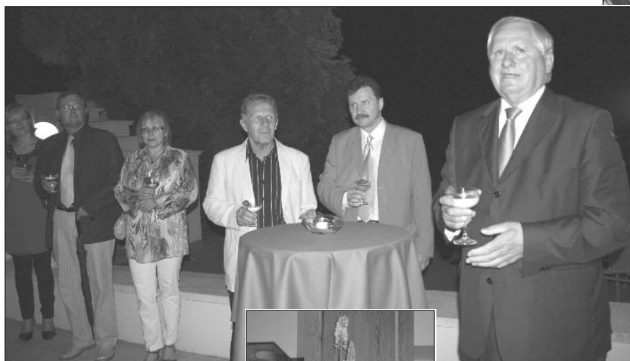
Příjemnou tečkou bylo společenské setkání na terase (a později uvnitř) Domu Bedřicha Smetany