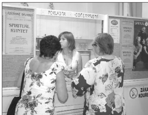
Poslední lístky u pokladny