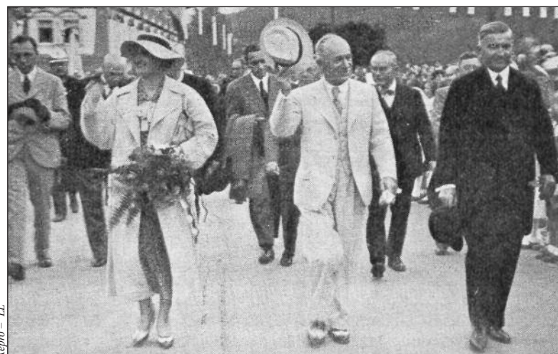
Návštěva prezidenta dr. Edvarda Beneše s chotí v Luhačovicích v r. 1936 – podle LZL téhož roku

V průběhu let zaznamenal zanikající a zase navazující lázeňský časopis i lehké kolísavou úroveň. V některých ročnících mu trochu docházel dech, neměl mnoho autorských článků, vypomáhal si básněmi, úryvky z knih, fejetony, vtipy, historkami a příspěvky lázeňských hostů, které většinou neměly profesionální kvality. Je si však třeba uvědomit, že jednotliví odpovědní redaktoři byli zaneprázdněni dalšími pracovními povinnostmi a psaní nebylo jejich profesí, ale na druhé straně do listů přispívali různí profesionálové, kteří si zdejší lázně oblíbili a pravidelně do nich v létě přijížděli. Naopak časopis otiskl v průběhu let velkou řadu odborných článků nejen od lékařů, kteří zde sezonně působili, ale i dalších odborníků, jež svá sdělení přednesli na odborných sjezdech, které se zde začaly pořádat. I když většina z nich vyzněla na podporu lázeňské léčby, představovaly osvětový efekt obecně. Především však lázeňský časopis poskytoval důležité informace nejen pro přijíždějící hosty, týkající se jejich pobytu, co všechno se vylepšilo a vybudovalo v další sezoně v lázních i v Luhačovicích atd. Ale i takové, které šly daleko za rámec místních požadavků např. informace o vycházejících knihách v pražských nakladatelstvích, premiérách, výstavách, příp. i menší postřehy ze zahraničí.