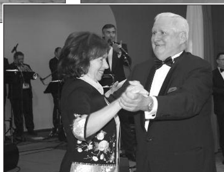
První valčík s první dámou první muž Lázní