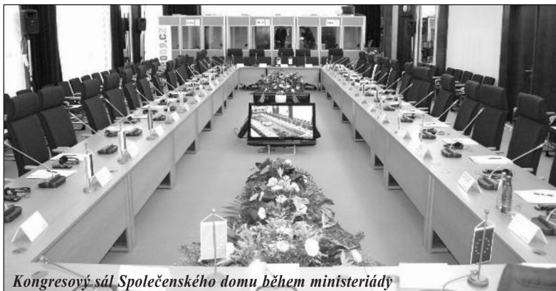
Kongresový sál Společenského domu během ministeriády