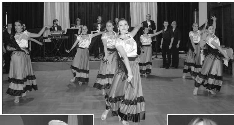
Španělské tance (koncertní sál)