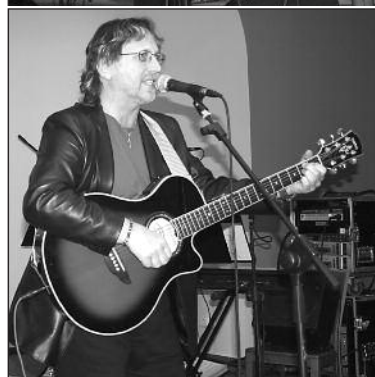
Dalibor Janda se svými hity (velký i koncertní sál)