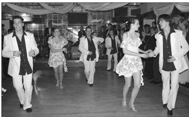
Karibik (Domino) – elegance, rytmus, mládež