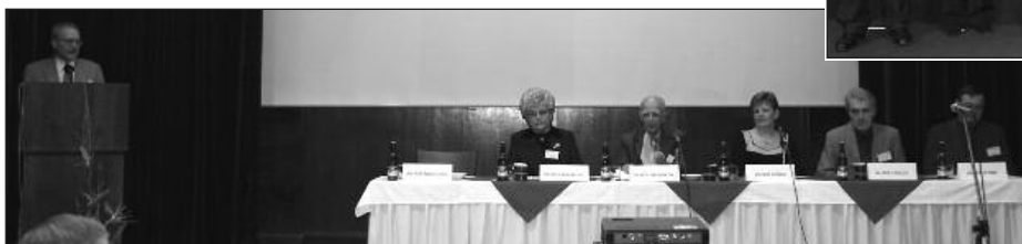
Na XVI. luhačovicke dny (26.-28. března), ale i na další lékařské kongresy přijeli odborníci z ČR i zahraničí