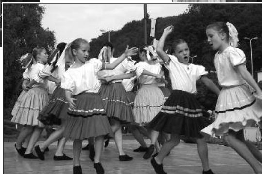
Také XVII. mezinárodní festival dětských folklorních souborů Písní a tancem 2009 přinesl do Luhačovic radost (11.-13. září)