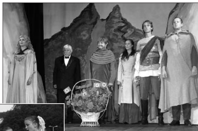
Text a foto – Marta Kozánková