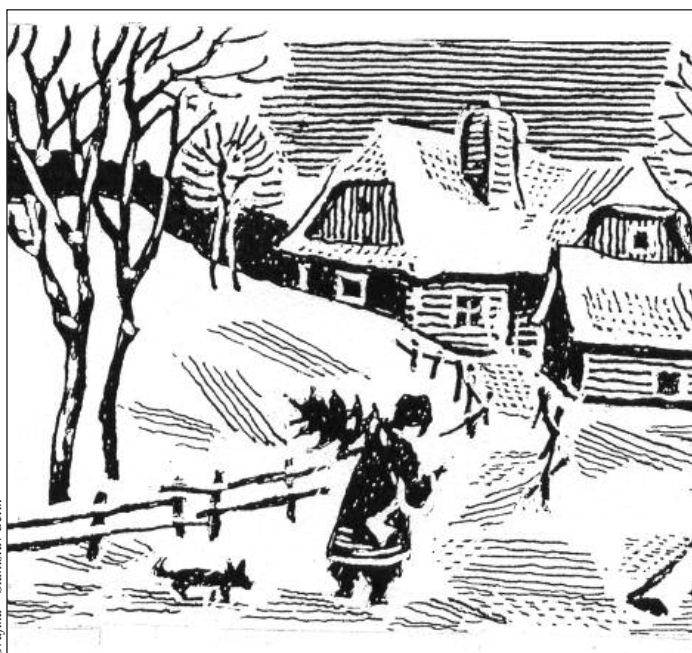
Grafika - Stanislav Bělík

Ozdobme symbol blížících se svátků a přichystejme pokrm sváteční. Svým blízkým splňme přání mnoha pátků, v tom čase míru, v době vánoční.