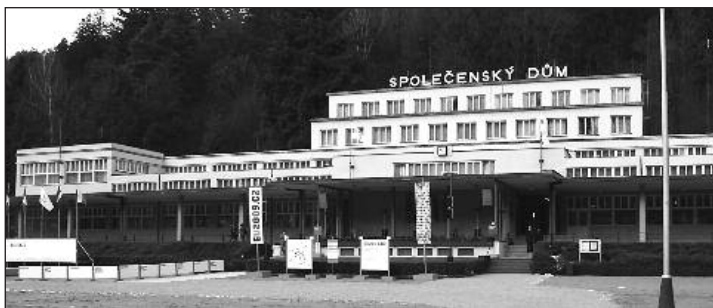
Zasedání ministrů EU prověřilo Lázně Luhačovice, a. s., po všech stránkách (22.-24. ledna)