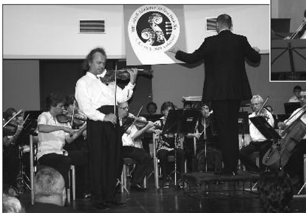
Akademie Václava Hudečka podporuje mladé houslové talenty (3.-14. srpna)