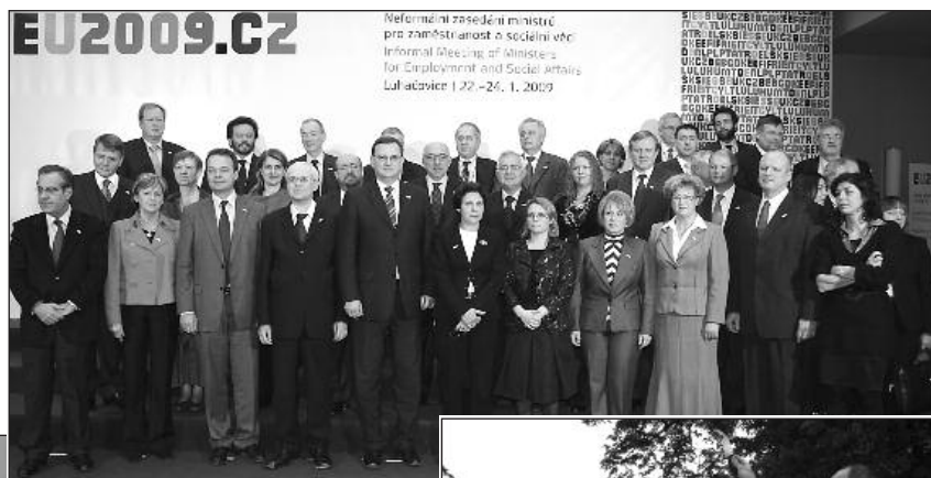
Informální zasedání ministrů pro zaměstnanost a sociální věci Informal Meeting of Ministers for Employment and Social Affairs Luhačovice 22.-24. 1. 2009