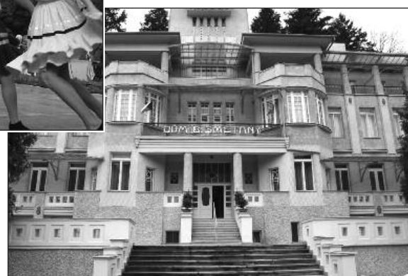
Hotel Dům Bedřicha Smetany se letos dožil 100 let od svého otevření