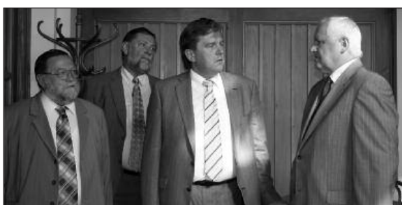
Předseda Poslanecké sněmovny PČR Ing. Miloš Vláček si při návštěvě Luhačovic mj. prohlédl Jurkovičův dům (24. srpna)