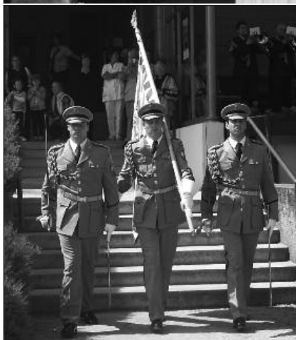
Jednotka Hradní stráže doprovodila již podruhé koncert Hudby Hradní stráže a Policie ČR (23. června)