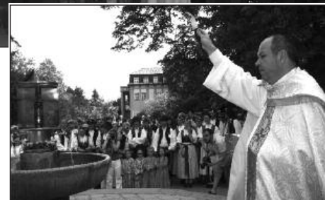
Slavnostní otevírání pramenů zahajuje hlavní lázeňskou sezonu (8.-10. května)