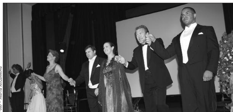
Závěrečná děkovačka v Lázeňském divadle po úspěšném představení Evžen Oněgin , jež vzniklo k počtě 210. výročí narození A. S. Puškina a 120. výročí premiéry stejnojmenné opery P. I. Čajkovského v Praze