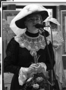
Text a foto Marta Kozánková