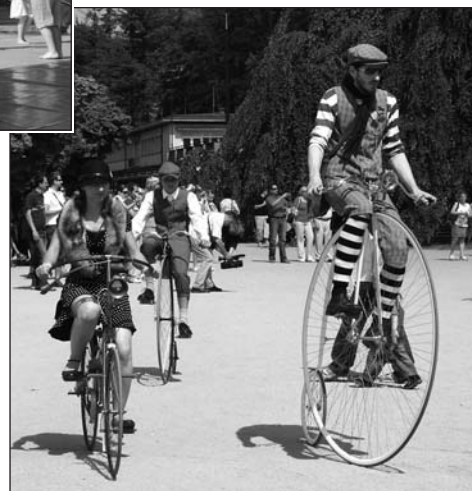
Historické bicykly atraktivní jako vždy