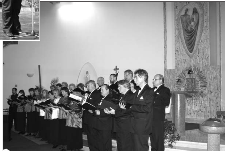
Folklorní návraty – Brezová z Brezové pod Bradlom, Malé Zálesí Luhačovice