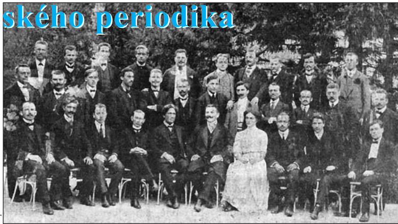
Členové lázeňského orchestru (České filharmonie z Prahy) v Luhačovicích – foto z r. 1910 (v LLL č. II, roč. II, 31. 7. 1910)