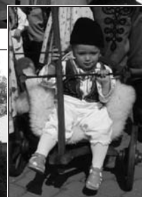
Odpolední slavnost zahájili představitelé kraje, města a Lázní