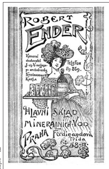
Ukázka inzerátu z téhož čísla LLL