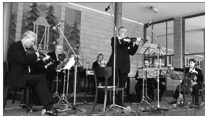
Salonní orchestr z Brna hrál na kolonádě