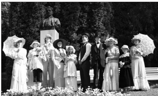
Společnost Leoše Janáčka