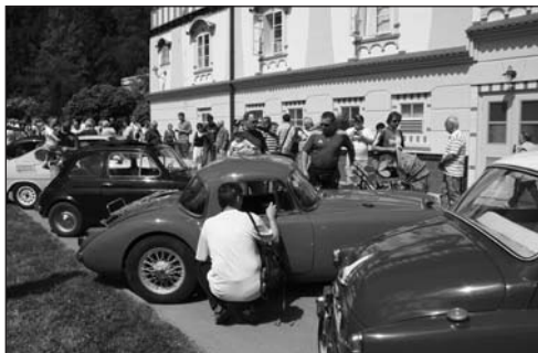
Historická vozidla v obležení