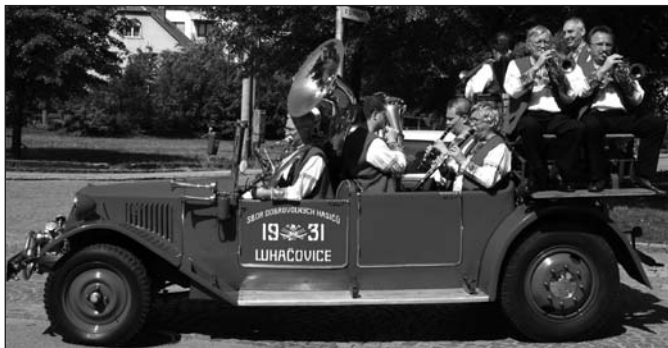
SOBOTA – Zálesanka pozvala návštěvníky