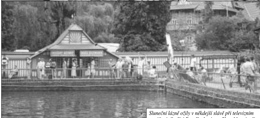
Sluneční lázně ožily v někdejší slávě při televizním natáčení. Ondřej Pavelka hraje ve filmu hlavní roli