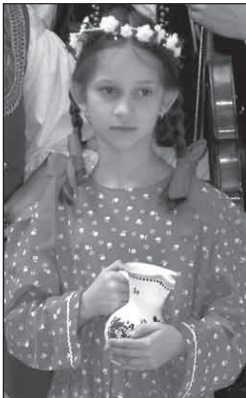
Vodolenka v Hale Vincentky.