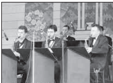
Atmosféru na Lázeňském náměstí příjemně doladoval soubor Dr. Swing.