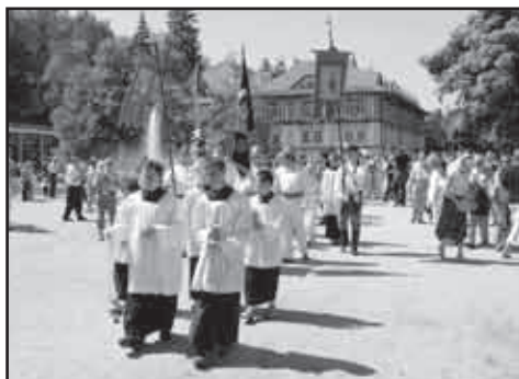
Slavnostní průvod při Svěcení pramenů přechází přes Lázeňské náměstí.