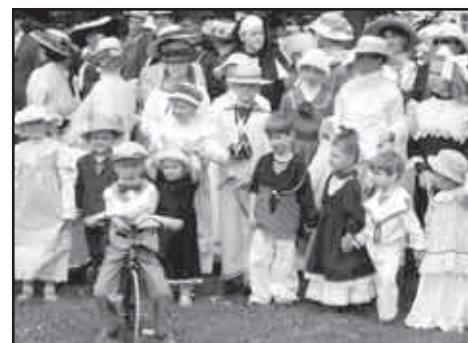
Lidé v dobových kostýmech se pohybovali po kolonádě i po okolních prostranstvích.