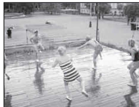
Odvážní a vytrvalí vzuchoplavci cvičili i v mohutné průtrži mračen.