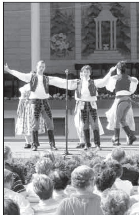
O radostné nedělní odpoledne se na Lázeňském náměstí staraly dětské soubory.