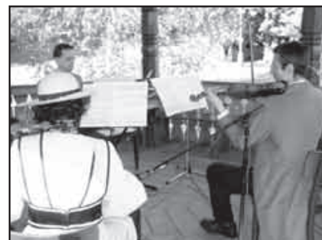
Brněnští Kumštýři z ochoty navodili atmosféru v altánu u Jestřabí.