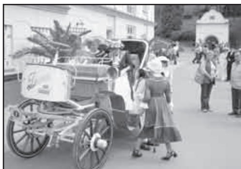
Přehlídka historických vozidel lákala malé i velké návštěvníky.